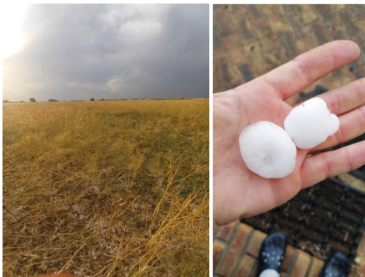
Dégâts sur Gy en Sologne