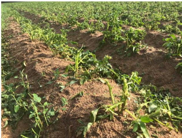
Dégâts Thenay sur Sarrasin et pommes de terre