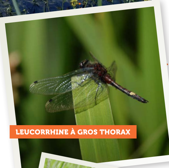
LEUCORRHINE À GROS THORAX

Sur les 68 espèces répertoriées en région Centre-Val de Loire, environ un quart est estimé menacé sur la liste rouge régionale. Parmi ces espèces, la Leucorrhinie à gros thorax ( Leucorrhinia pectoralis ) est une espèce d'intérêt européen et jugée en danger d'extinction. Elle est présente en Sologne sur des nombreux milieux de mares et d'étangs, généralement à proximité des contextes forestiers. Elle apprécie les zones humides peu profondes, bien éclairées avec une eau claire où la végétation est luxuriante. Par temps couvert les adultes se cachent dans les arbres et arbustes à proximité, ils sont alors difficilement repérables.