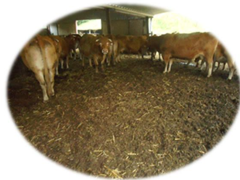
Vaches limousines sur plaquettes bois: la litière est noire mais les vaches sont propres