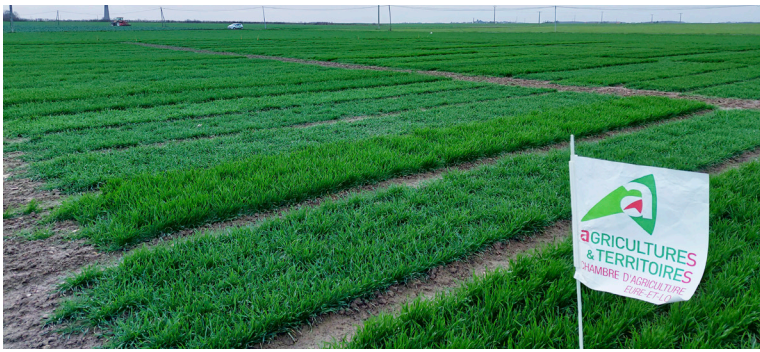
Les différences de reprise de végétation sont bien visibles dans les essais variétés blé tendre.

La Chambre d'agriculture mène chaque année une quarantaine d'essais sur tout le territoire eurélien. Zoom sur les principales thématiques de 2023 !