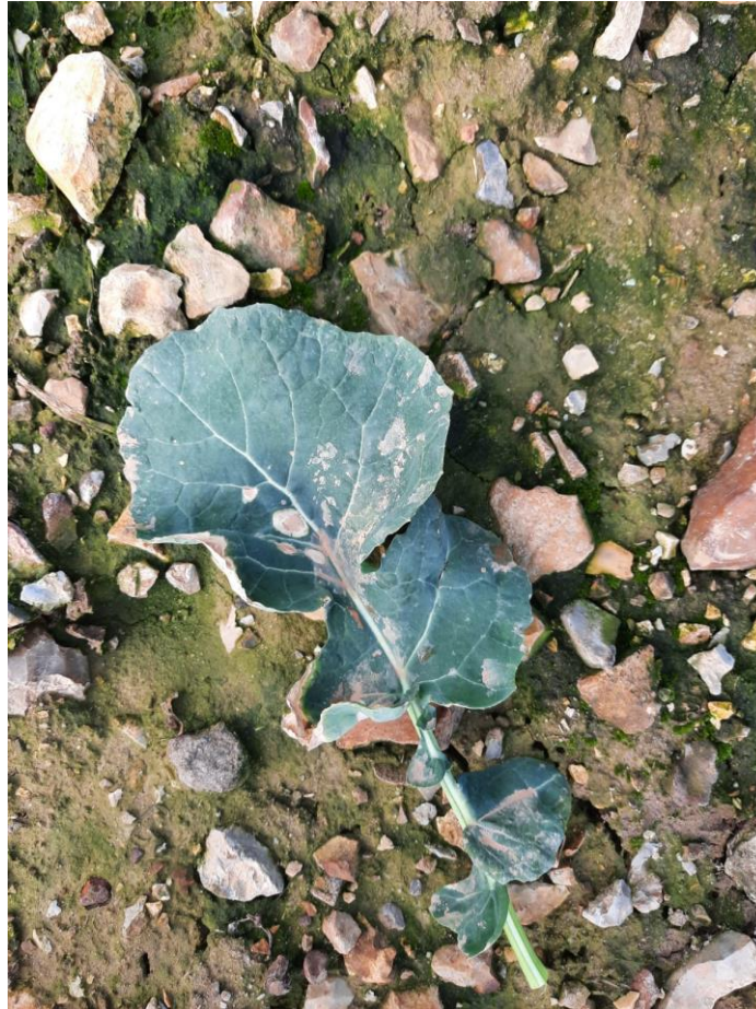
Brûlures de feuilles – Sable Sahara Photo UCATA Nord Cher – 22/03/2022

Suite à l'épisode des « pluies de sable du Sahara » semaine dernière des symptômes de brûlures physiologiques sont observées en plaine. Ces symptômes ne sont pas en lien avec une quelconque maladie foliaire.