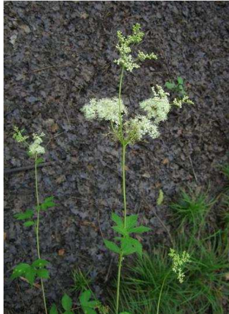
Reine des prés