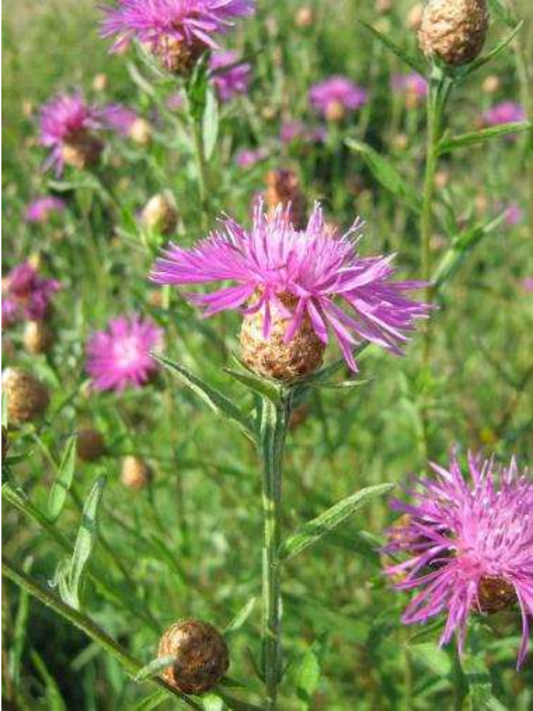
16 - Centaurées ou Serratules