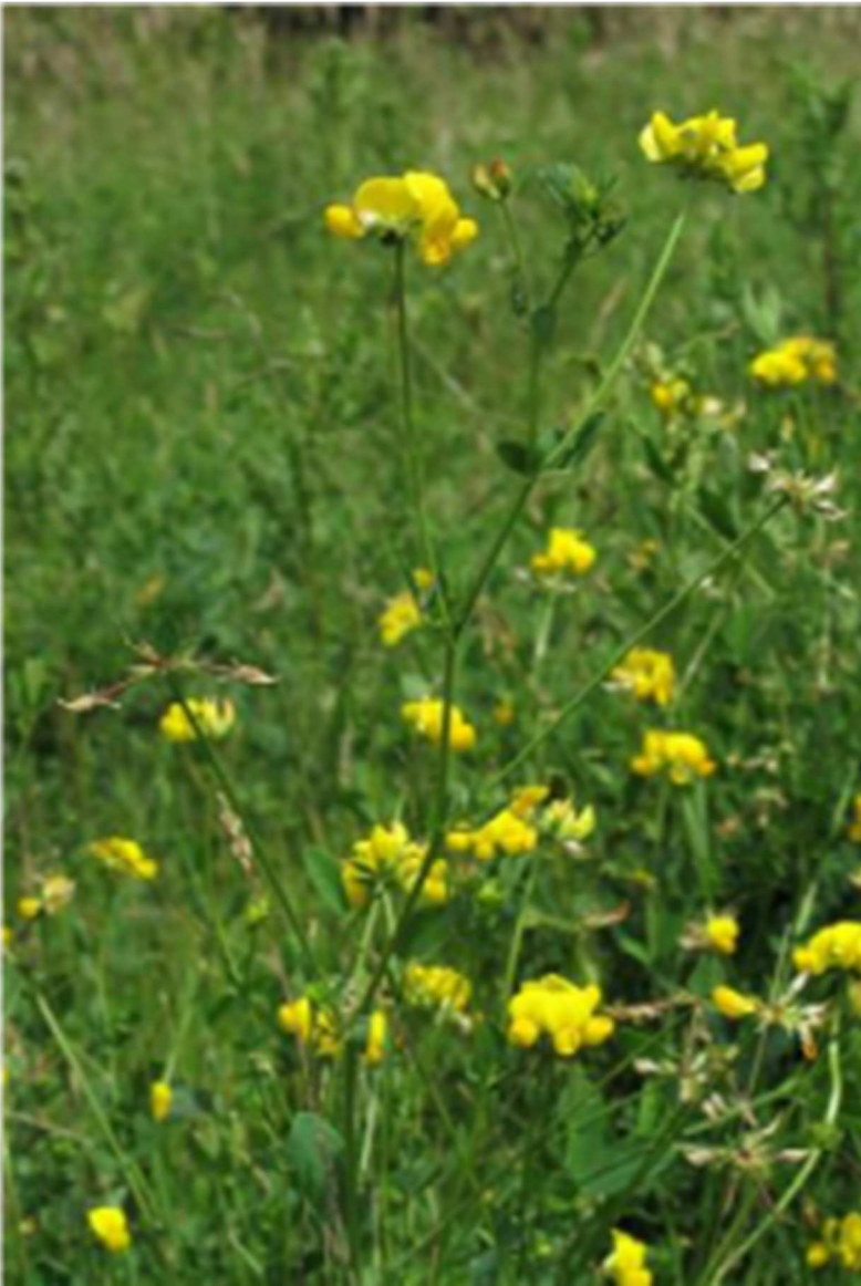
12 – Lotiers