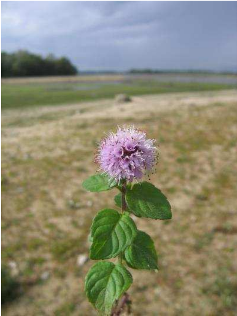
1 - Menthes